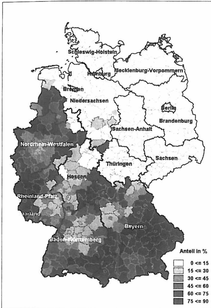
Abbildung 2b: Katholikenanteile 2001/02