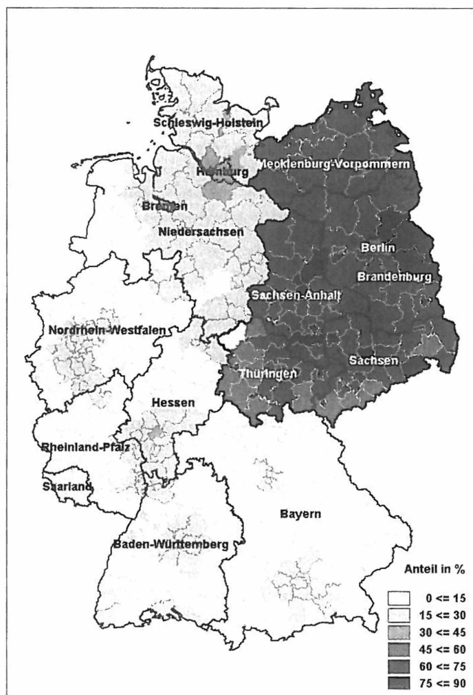
Abbildung 2c: Konfessionslosenanteile 2001/02